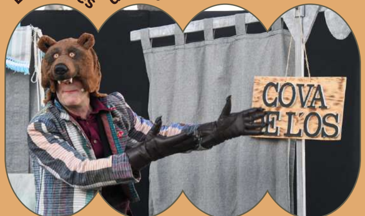
Les urpes de l'Os

A l'Os li agrada mostrar la potència de les seves urpes i talla arbres a tort i a dret. Un dia, després d'unes llargues pluges troba la seva cova devastada per una riuada. Vol trobar-ne el culpable que segons ell no pot ser altre que el castor, l'encarregat de controlar la presa del riu. Però serà realment el castor el culpable?