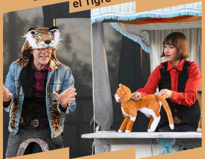
El Gat i el Tigre