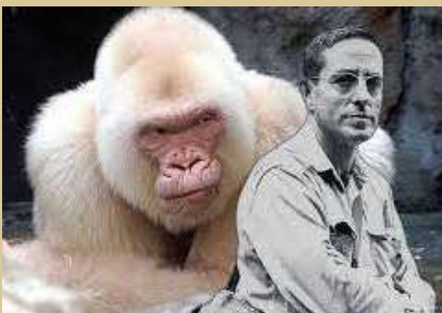
Jordi Sabater i Pi